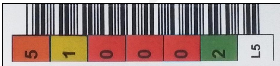
Figura 02 – Exemplo de etiqueta para fita LTO 5.